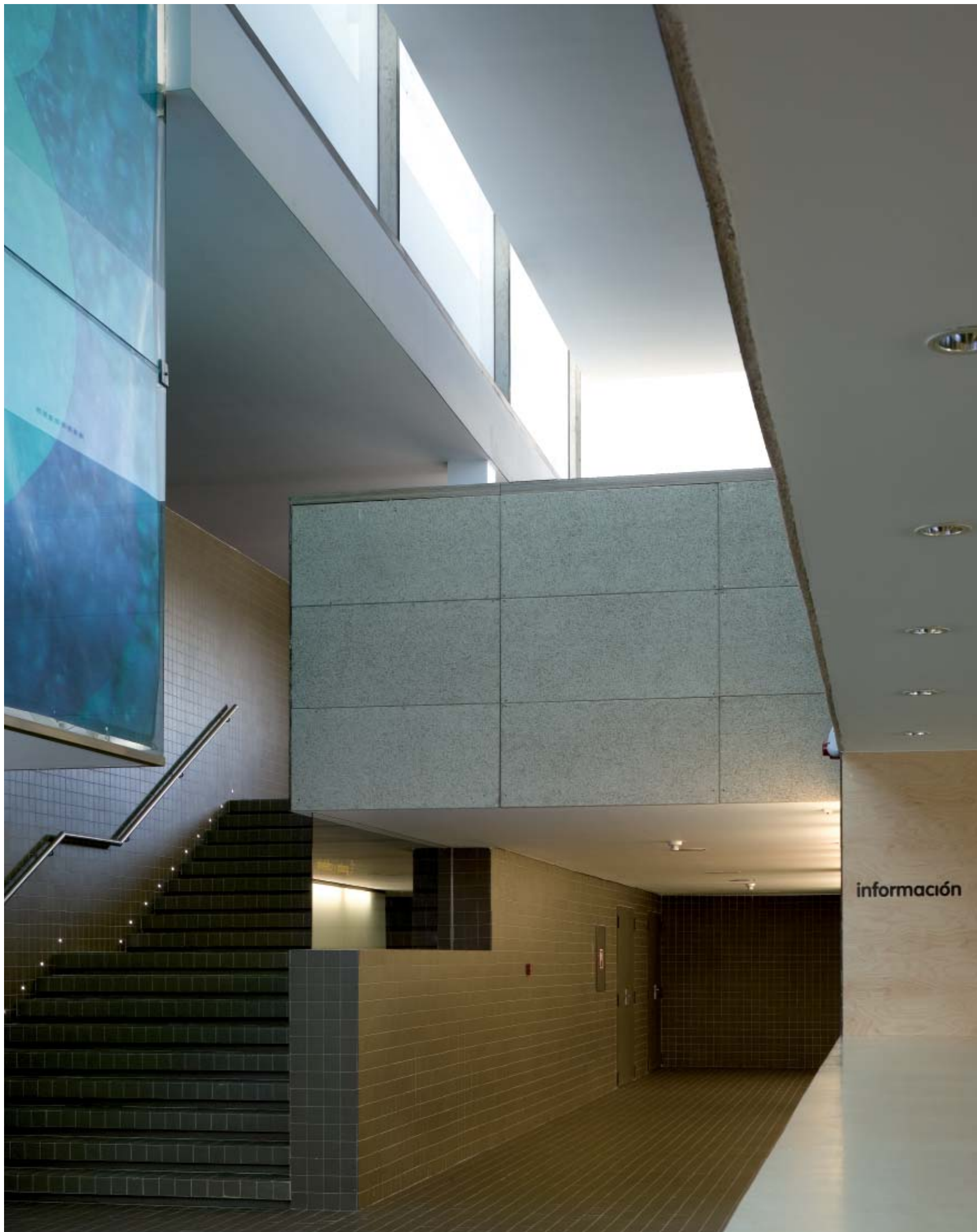
Vom Eingangsbereich führt eine breite Treppe auf die Galerie im zweiten Geschoss. A wide stair leads from the entrance area to the gallery on the second level.