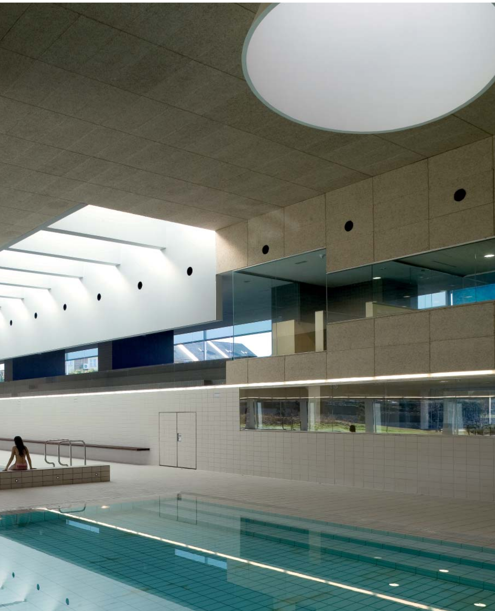
Eine durchgehende Decke und die horizontale Betonung unterstützen den geradlinigen Charakter. An uninterrupted ceiling and the horizontal accentuation reinforce the straight character.