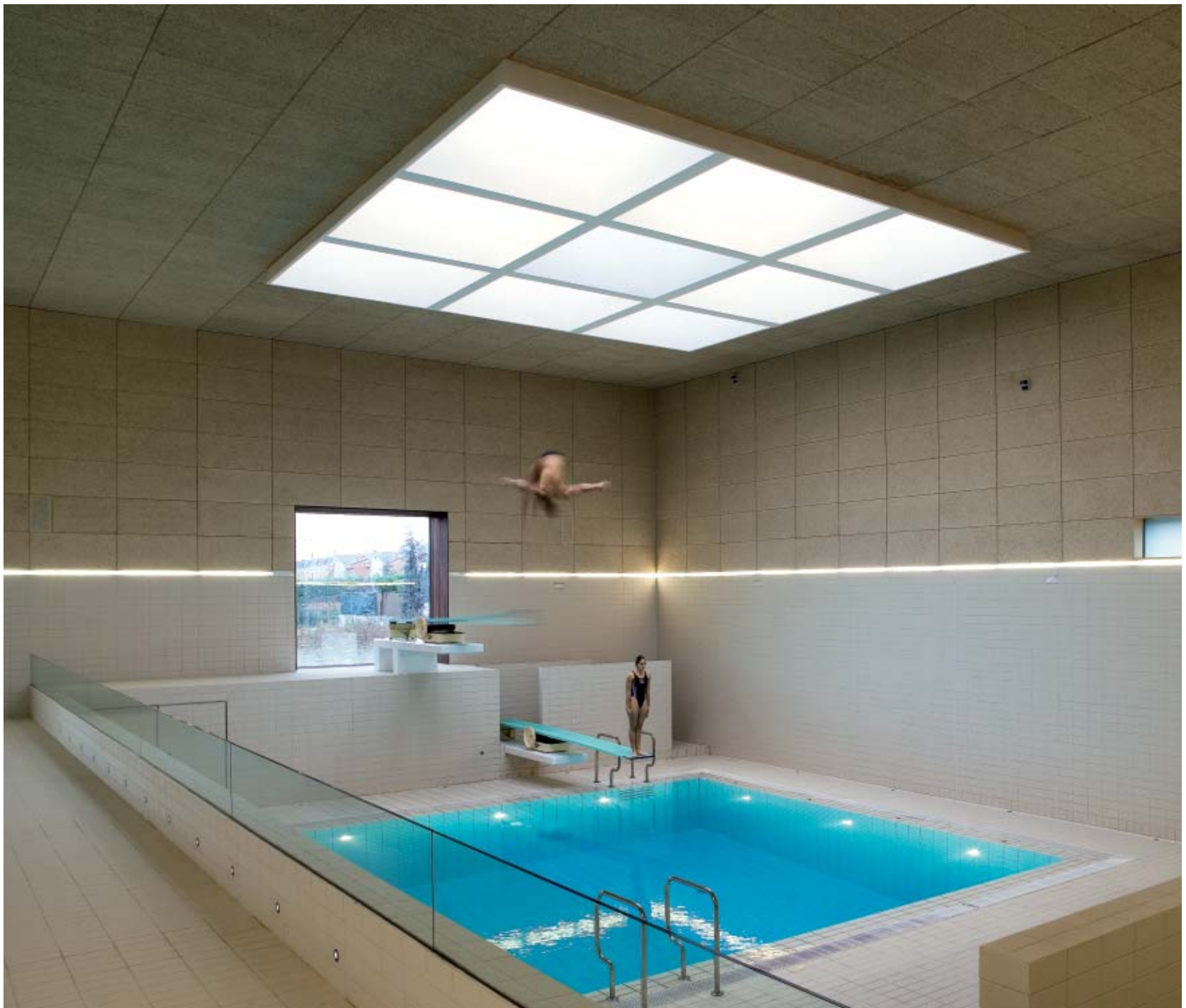
Das Sprungbecken wurde tiefer positioniert, um einen Versprung in der Decke zu vermeiden. The diving pool was positioned at a lower level to avoid a recess in the ceiling.